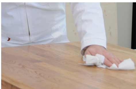
ELIMINARE L'ECESSO DI PRODOTTO