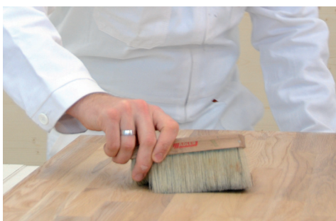
ELIMINARE LO SPORCO E LA POLVERE