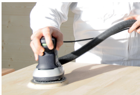
LEVIGARE LE SUPERFICI