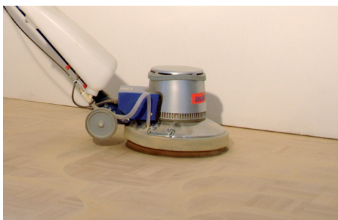
LEVIGARE IL PAVIMENTO