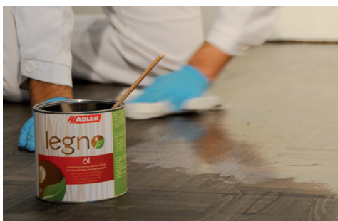
RIPETERE L'APPLICAZIONE CON LEGNO-ÖL O LEGNO- HARTWACHSÖL