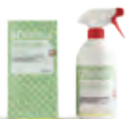
.Biosistem Spray detergente igienizzante per pareti

Ricordate la presenza di muffe e funghi può essere dannosa per la salute.